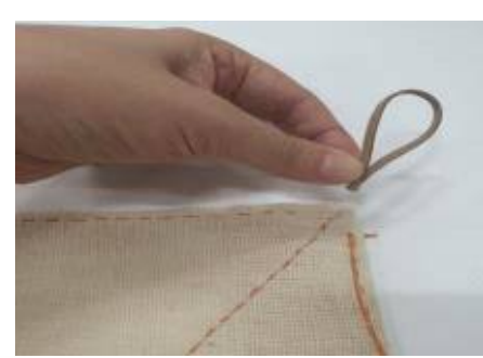
마무리 매듭 전 모서리에 끈달기