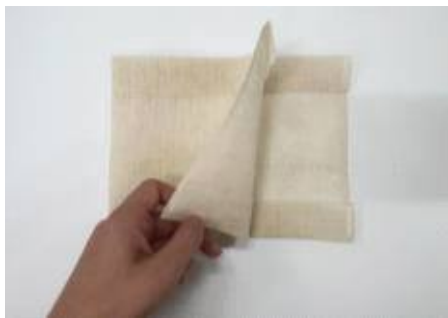
양쪽 3cm가량 접은후 반으로 접기