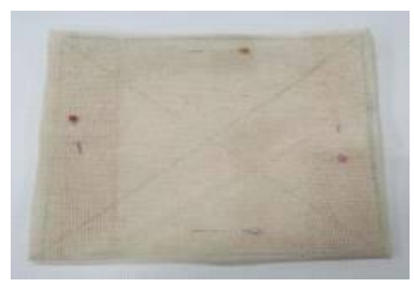
시침핀으로 천을 고정하기(생략가능)