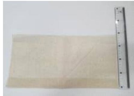
천길이 긴방향 쪽 3cm가량을 안으로 접기