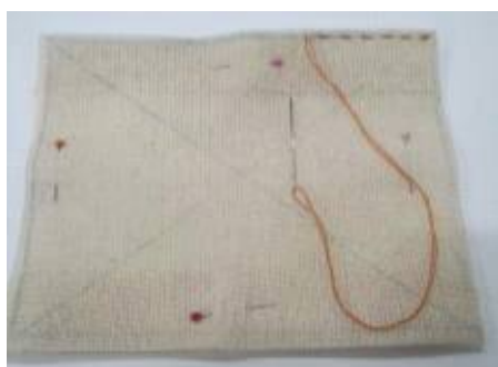
흠질로 선을따라 바느질하기