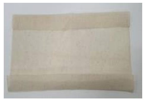
양쪽 다 접어 넣기